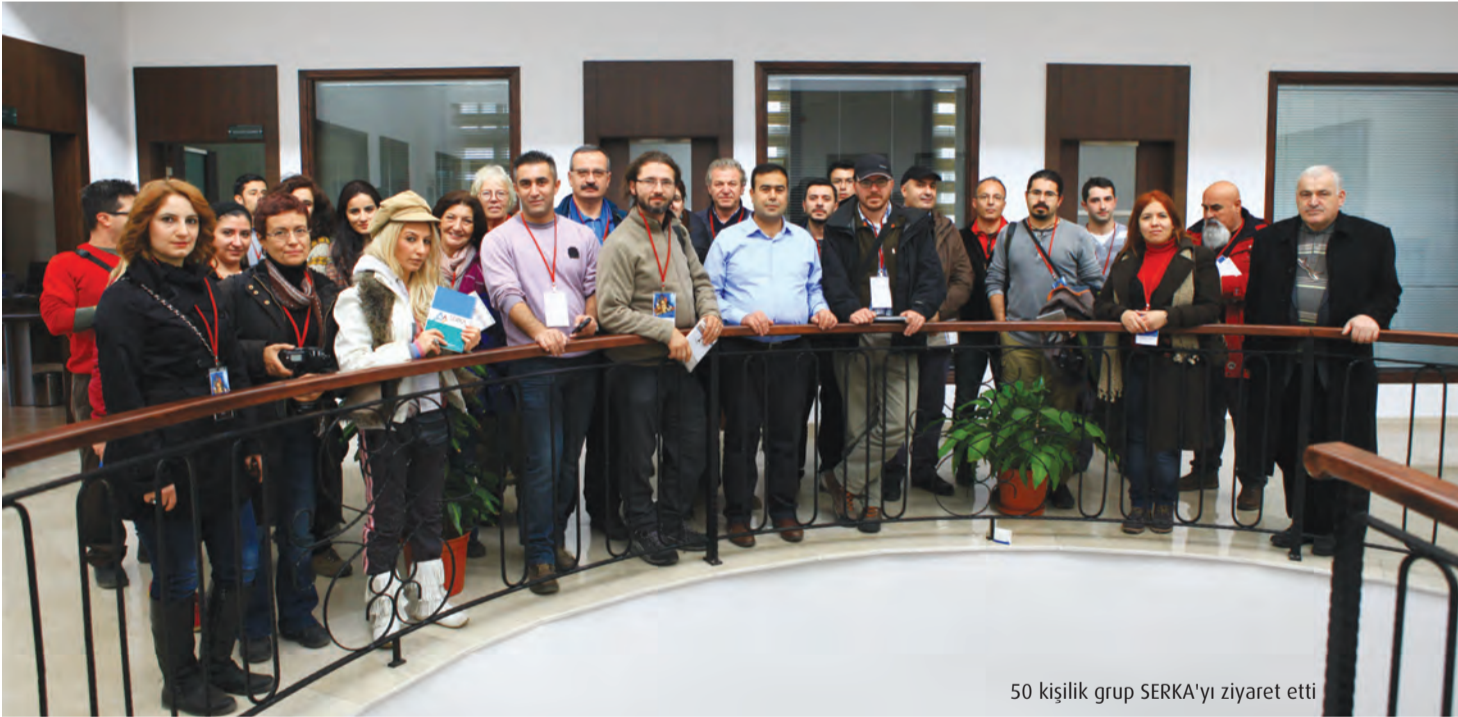
50 kişilik grup SERKA’yı ziyaret etti

olacak. İnsanlar buraya niye gideyim diye bize soruyorlar. Bunu, böyle bir marka üzerinde durulursa, işte şu markadan, atıyorum işte peynircilik veya burada inanılmaz bir doğa var. Yani Avrupa’da, diğer farklı kıtalarda özellikle spor konusunda inanılmaz bir talep var. Sportif faaliyetler konusunda da bazı markalar olabilir. Yani baktım parkurlara